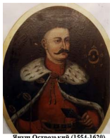
Януш Острозький (1554-1620)

Навчаючись ще в юнні роки у Відні, при дворі австрійського імператора Максиміліана I, князь Іоанн Острозький під впливом єзуїтів полишив православну віру і став католиком з ім'ям Януш. Він досягнув найбільших політичних висот з усіх представників династії Острозьких і посідав найвищу світську посаду в Речі Посполитій – каштеляна Краківського, був одним з найбагатших магнатів свого часу, користувався великим впливом і авторитетом серед шляхти та відзначався великою побожністю.